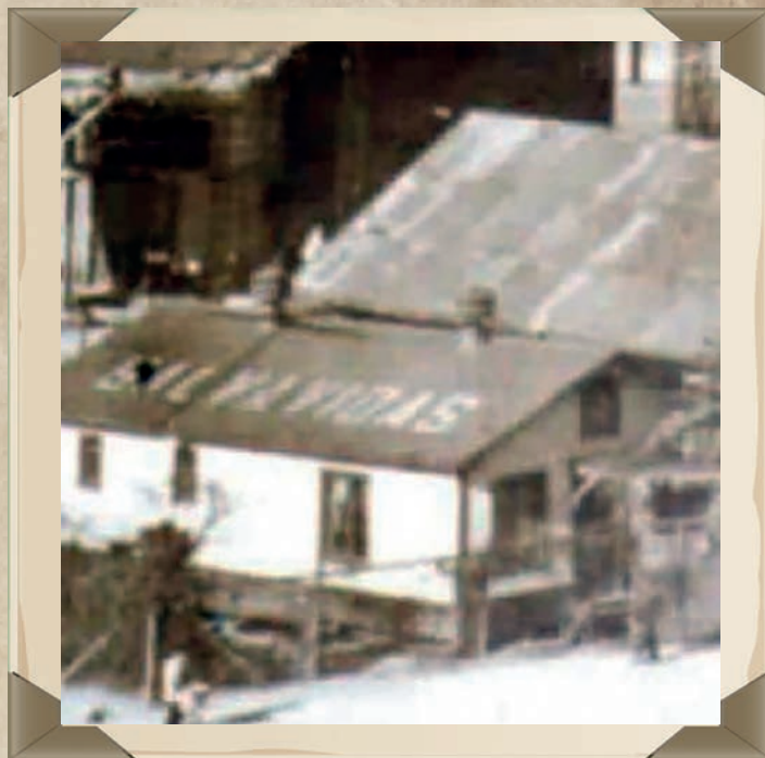
Cuartel del CVBSV en el Muelle Prat, opero entre los años 30 y el inicio de los 60. Su ubicación era al frente de la actual Capitanía de Puerto..

El Comandante Christiansen estaba interesado en la fusión y por ello solicitó que los voluntarios de la brigada comenzaran a ser parte de las tripulaciones del Bote Salvavidas y a la vez, los voluntarios del Bote que no estén con la capacidad de embarcar realizarán labores con los brigadistas desde costa. En el cuartel del Bote