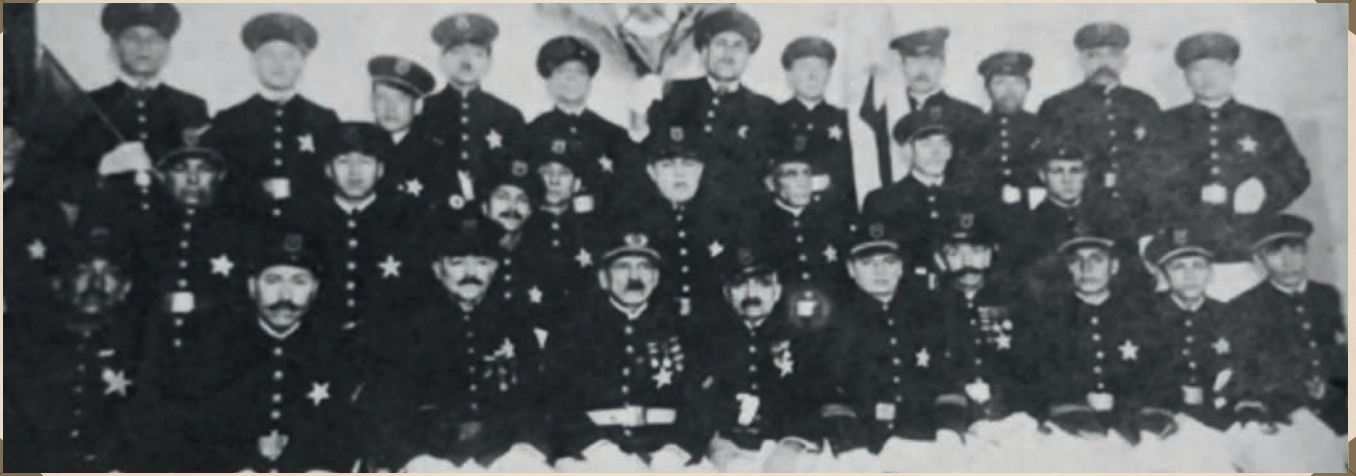
Voluntarios del Cuerpo de Salvavidas de Valparaíso.

Posteriormente un 7 de agosto de 1.882, la Unión Masónica para propagar el salvamento de vidas forma un cuerpo operativo que realizará los rescates desde tierra al cual denominan Cuerpo de Salvadores de Valparaíso, que estaba compuesto exclusivamente por Voluntarios que en su mayoría eran miembros activos de las Compañías 5° y 8° del Cuerpo de Bomberos de Valparaíso, posteriormente se unen otras personas ajenas a Bomberos. Estos operaban los equipos que adquirió la Unión Masónica en Europa y que consistían en fusiles de la marca Cordes, cajas de cuerdas, aparatos lanza cohetes, chalecos salvavidas de coreho, un cañón lanza cuerdas que decora hoy en día nuestra entrada al cuartel y folletos explicativos sobre la manera de prestar auxilio a los náufragos.