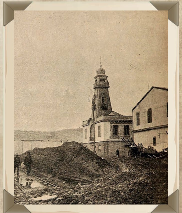
Cuartel de la primera Brigada Salvavidas del Cuerpo de Salvavidas de Valparaíso en "Caleta Jaime".

dentro del inventario todos los implementos de la antigua organización; la fusión culminó de forma legal en abril de 1.892, cuando la Unión Masónica traspaso todo su material de salvataje. Al igual que la Unión Masónica que estuvo constituida exclusivamente por Voluntarios, el nuevo Cuerpo se organizo en tres estamentos, los Voluntarios Cooperadores y dos Brigadas; la Primera Brigada de Voluntarios Salvavidas y la Segunda Brigada de Voluntarios Bogadores Salvavidas. A ellos se sumada el Directorio General del CSV.